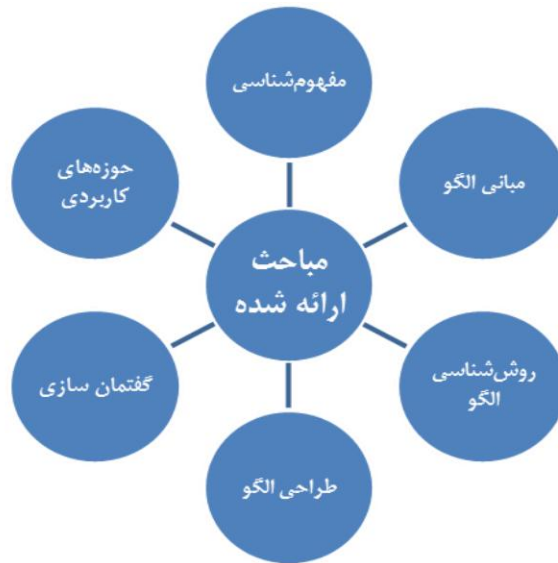
شکل ۱. موضوعات اصلی مقالات سلسله نشست‌های الگوی اسلامی - ایرانی پیشرفت