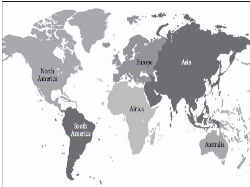
شکل (۱): نقشه جهان